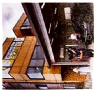
埼玉県にあるG-POWER LABO.。施工から販売まで施工、講習会も行う。

株式会社 G-POWER 〒117-0001 東京都豊島区池袋3-4-8 新大塚ビル10F ☎ 03-6997-1380 E: info@power-lab.jp HP: http://g-power.jp/