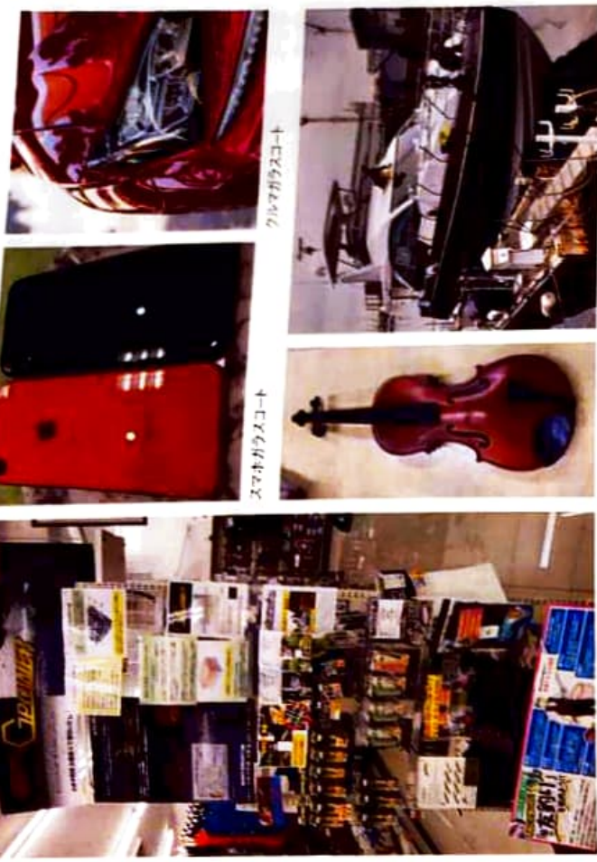
クルマガラスコート

この商品シリーズにより、「用途無限大」が確立。あらゆるものに塗布でき、塗布したものを衝撃や汚れから守り、国内外に需要が伸びている。海外輸出実績10カ国、国内で、統括代理店、代理店、